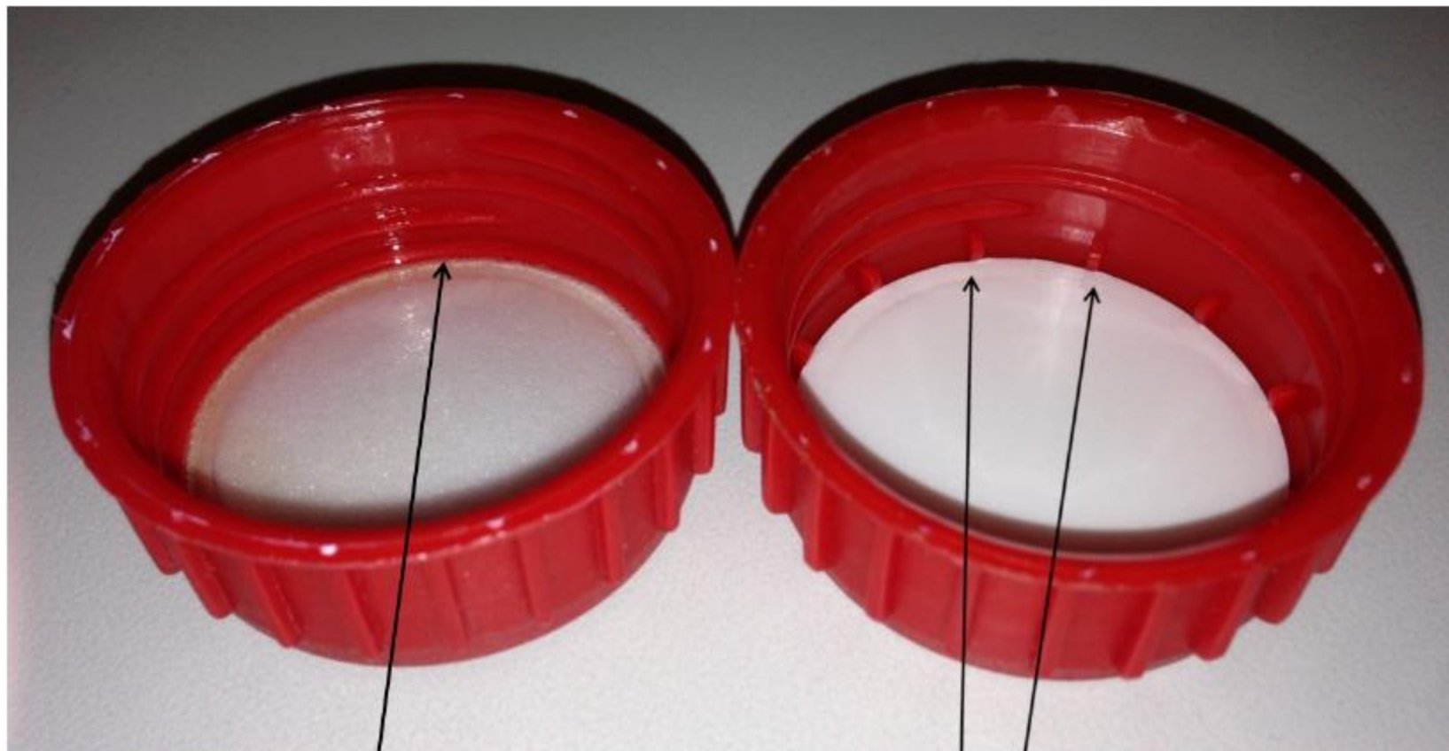
Víčko padělaného Balení.